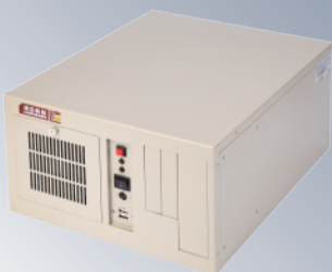
RK-608M1 壁挂式工业机箱 带前置风扇